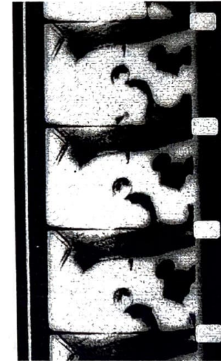
Coca Strip (16 mm, 1985)

AVANT 2005 is dedicated to Olle Hedman and the following subject: "how may film in itself function as a way of articulating film-theoretical or film-aesthetical questions?"